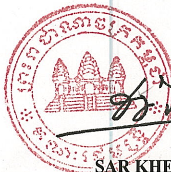
SAR KHENG Prime Minister a.i.

In witness whereof the undersigned, the Prime Minister of the Royal Government of Cambodia, with full powers duly entrusted to him, has signed this delegation of full powers.